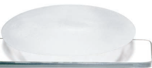
Profil Moderate nejširší základna | nižší profil