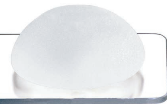
Profil High užší základna | vyšší profil