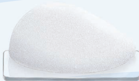
CPG™ 332, COHESIVE III™, Tall Height, Moderate Plus Projection