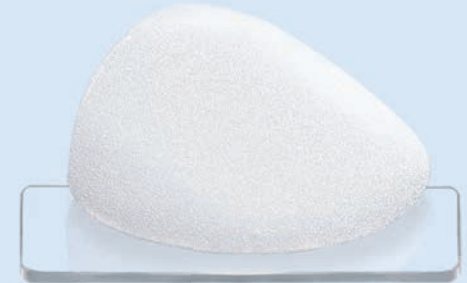
CPG™ 313, COHESIVE III™, Low Height, High Projection