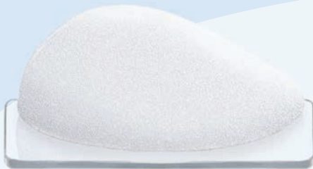
CPG™ 331, COHESIVE III™, Tall Height, Moderate Projection