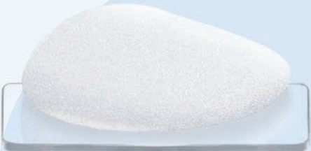
CPG™ 321, COHESIVE III™, Medium Height, Moderate Projection