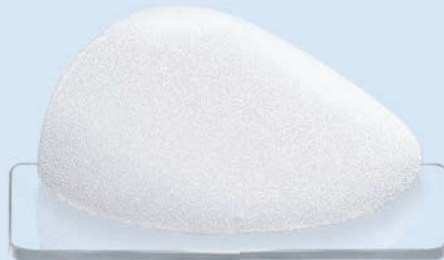
CPG™ 322, COHESIVE III™, Medium Height, Moderate Plus Projection