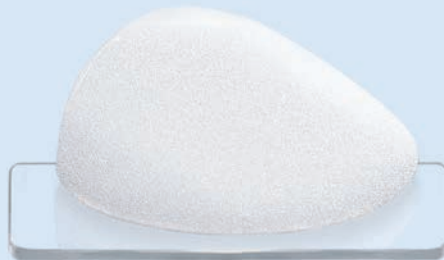
CPG™ 312, COHESIVE III™, Low Height, Moderate Plus Projection