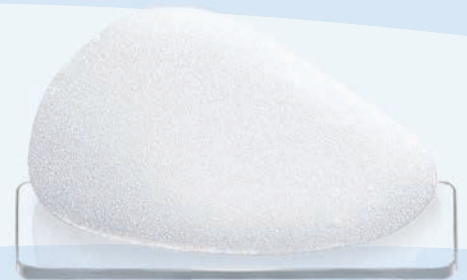
CPG™ 333, COHESIVE III™, Tall Height, High Projection