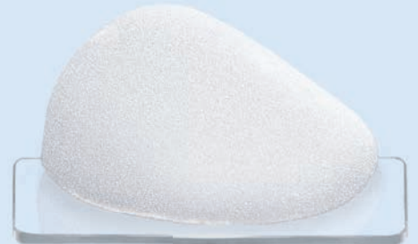
CPG™ 323, COHESIVE III™, Medium Height, High Projection