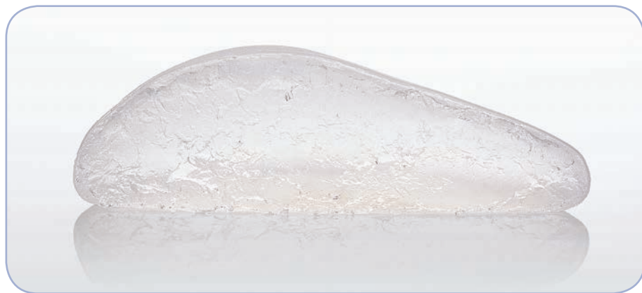
Řez implantátem Contour Profile® s kohezivním gelem Cohesive III™

Patentovaný kohezivní silikonový gel od společnosti Mentor drží rovnoměrně tvar a podobá se na dotek skutečné prsní tkáni. Krásně poddajný. Pevný, ale ne tuhý. MemoryGel® nabízí pacientkám přirozenější vzhled i pocit. Díky variabilitě gelových komponentů produkuje společnost Mentor širokou škálu konzistencí od měkkých (Cohesive I™) po pevné (Cohesive III™).